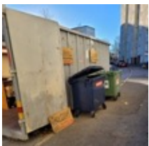
Fredag morgon på plats vid FB44

Helgen 1 - 3 november stod höst-containeren på gatan utanför FB 44.